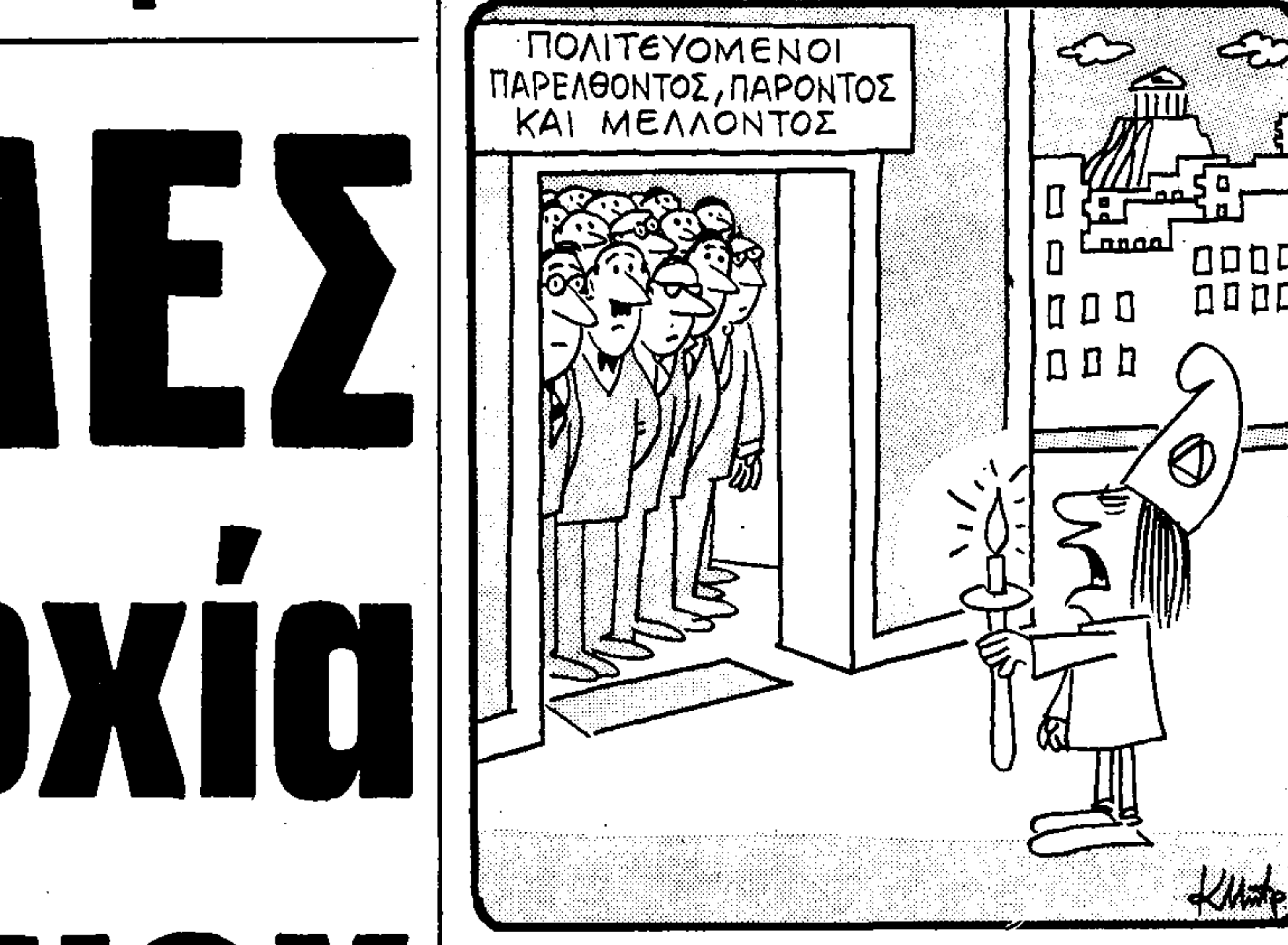
— Δείτε λάβετε φως! —